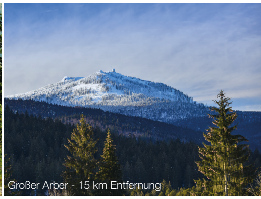
Großer Arber - 15 km Entfernung