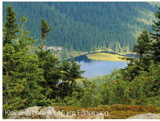
Kleiner Arbersee - 16 km Entfernung

Das Hotel Ahornhof liegt direkt am Waldrand, in der Nationalparkgemeinde Lindberg, im Landkreis Regen. Die Gemeinde gehört zur Urlaubsregion Arberland und ist Dank der einzigartigen Natur und den facettenreichen Freizeitmöglichkeiten im Sommer wie im Winter ein beliebtes Urlaubsziel. Inmitten der Wanderregionen Arber und Falkenstein, sowie dem böhmischen Nationalpark Sumava, bietet Lindberg nicht nur interessante Sehenswürdigkeiten, sondern auch Vielzahl an sportlichen Aktivitäten. Das riesige Wanderwegenetz umfasst das Rotwildgehege Scheuereck, den Riesberg, den Latschensee, den Hausberg - den Großen Falkenstein - sowie die Ortsteile Buchenau und Zwieslerwaldhaus. Im Winter bietet der Große Arber mit seinen Berghängen nahezu grenzenloses Schneesvergnügen und ist eines der beliebtesten Skigebiete des Bayerischen Waldes. Ausspannen können Gäste des Hotels anschließend im hoteleigenen Schwimmbad, den Saunen oder auch bei professionellen Spa-Anwendungen. Im Sommer kann der Außenpool mit Liegewiese genutzt werden.