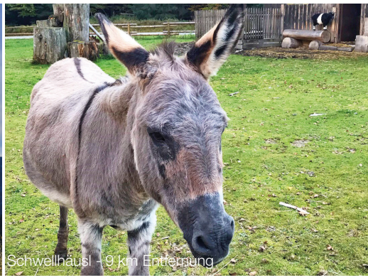
Schwellhäusl - 9 km Entfernung